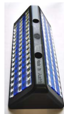
Universal Reflektor neu

Bitte ausfüllen: Besteller bzw. Ansprechpartner für Rückfragen, Lieferadresse, Datum und Unterschrift (Stempel)